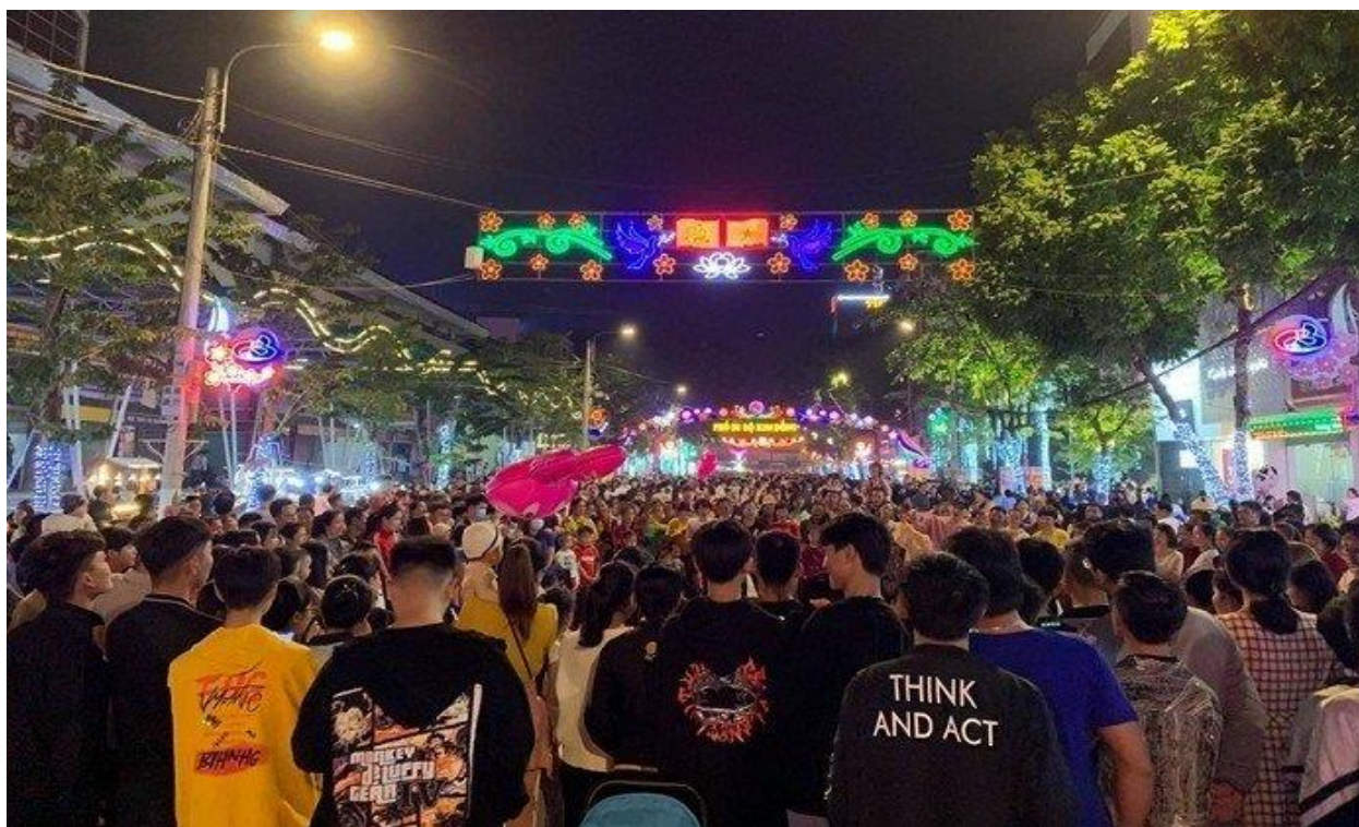
Du khách tham quan tại Phố đi bộ Kim Đồng

Trân trọng đề nghị các cơ sở kinh doanh dịch vụ lưu trú, nhà hàng, quán cafe, giải khát đăng ký tham gia điểm hỗ trợ nhà vệ sinh miễn phí cho du khách khi tham gia các hoạt động tại Phố đi bộ. (Sử dụng nhà vệ sinh của cơ sở kinh doanh để cho du khách sử dụng khi có nhu cầu, có gắn biển chỉ dẫn do Thành phố đầu tư đồng bộ); Trang bị đồng phục cho nhân viên, người lao động tại cơ sở kinh doanh để quảng bá hình ảnh thương hiệu, tăng cường nhận diện loại hình dịch vụ của đơn vị đối với du khách; Khuyến khích áp dụng các hình thức thanh toán không dùng tiền mặt như: Chuyển khoản qua tài khoản ngân hàng thông qua quét mã QR, ví điện tử và các loại hình thanh toán trực tuyến khác... để nâng cao chất lượng phục vụ, thuận tiện cho du khách sử dụng các dịch vụ tại cơ sở kinh doanh đồng thời tham gia tích cực vào chuyển đổi số.