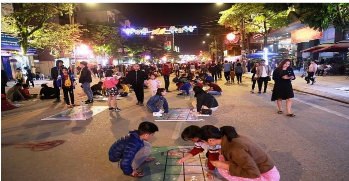
Hoạt động tại Phố đi bộ Kim Đồng

gia; Lập danh sách các cơ sở đăng ký tham gia, thiết kế mẫu biển chỉ dẫn đảm bảo phù hợp với không gian cảnh quan, mỹ quan chung để áp dụng thực hiện đồng bộ.