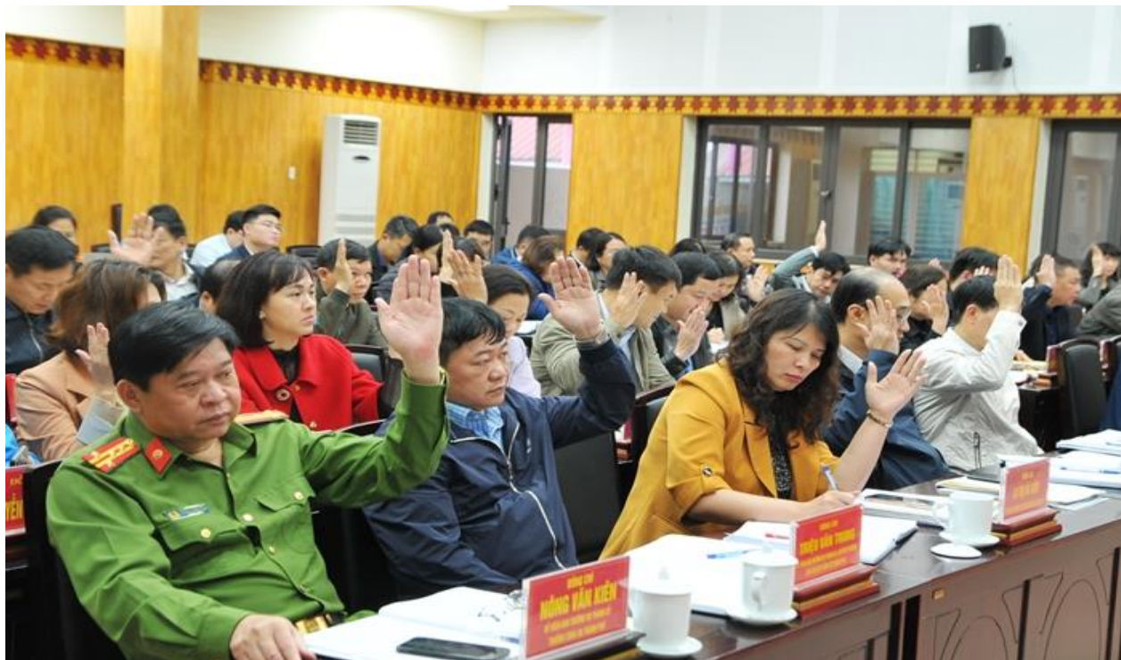
Các đại biểu biểu quyết thông qua Nghị quyết Hội nghị BCH Đảng bộ thành phố Cao Bằng lần thứ 21

công tác giải phóng mặt bằng. Tạo điều kiện cho các hộ gia đình đã giải phóng mặt bằng đến khu tái định cư trên cơ sở đảm bảo đúng quy định của pháp luật. Đẩy nhanh tiến độ dự án xây dựng hạ tầng khu dân cư và tiến hành đấu giá giá trị quyền sử dụng đất trong thời gian sớm nhất tạo nguồn lực cho đầu tư. Thực hiện đồng bộ, có hiệu quả các chính sách an sinh xã hội, công tác giảm nghèo. Nâng cao trách nhiệm của người đứng đầu các cơ quan, đơn vị trong công tác tiếp dân, giải quyết khiếu nại, tố cáo và công tác phòng, chống tham nhũng, tiêu cực.