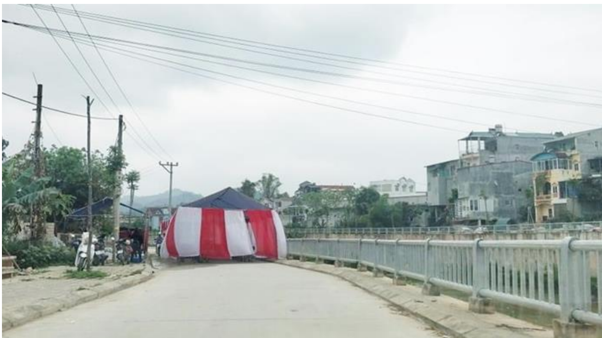
Một hộ dân tại phường Hợp Giang đã cho dựng rạp cưới choán hết cả đường đi lại của người dân

Thời gian qua, việc tuyên truyền, vận động, hướng dẫn, thực hiện nếp sống văn minh trong việc cưới, việc tang trên địa bàn Thành phố bước đầu đã tạo được những chuyển biến tích cực, góp phần xây dựng nếp sống văn hóa lành mạnh, tiến bộ. Tuy nhiên, việc thực hiện nếp sống văn minh trên địa bàn vẫn còn một số hạn chế như: việc cưới, việc tang ở một số gia đình, địa phương còn kéo dài trong nhiều ngày, kéo theo việc tổ chức ăn uống, nhiều hủ tục rườm rà, lãng phí thời gian, tiền bạc; việc sử dụng loa đài quá âm lượng và thời gian quy định trong đám cưới, việc dựng rạp lấn chiếm lòng, lề đường cản trở giao thông... đã gây bức xúc, ảnh hưởng đến sinh hoạt của cộng đồng dân cư, mỹ quan đô thị.