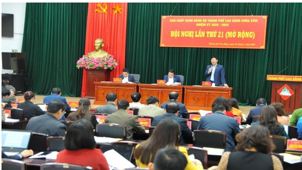
Quang cảnh hội nghị

Chiều 10/4, Đảng bộ thành phố Cao Bằng đã tổ chức Hội nghị Ban chấp hành lần thứ 21 (mở rộng) nhằm đánh giá kết quả lãnh đạo, chỉ đạo thực hiện nhiệm vụ quý I, triển khai phương hướng, nhiệm vụ trọng tâm 9 tháng cuối năm 2023.