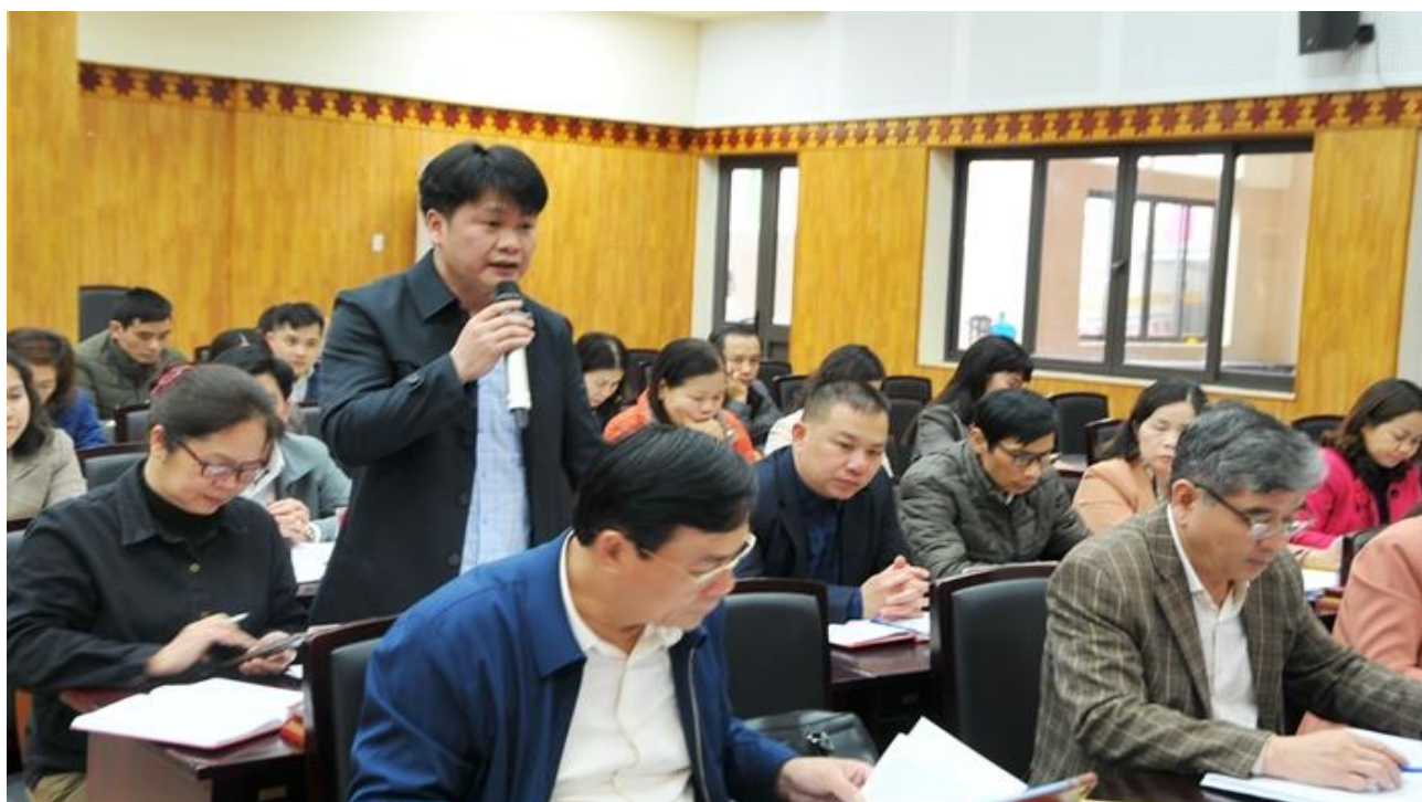
Lãnh đạo phường Sông Bằng (Ảnh dưới) phát biểu thảo luận tại hội nghị

Công tác xây dựng Đảng được quan tâm thực hiện có hiệu quả. Công tác kiểm tra, giám sát; công tác phát triển đảng viên được tập trung chỉ đạo. Trong quý I thẩm định, kết nạp 05, công nhận 85 đảng viên chính thức. Tổ chức, bộ máy các cơ quan, đơn vị được sắp xếp, kiện toàn, nâng cao chất lượng hoạt động.